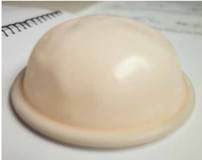
(échelle = environ 7 cm de diamètre)

Il existe des moyens contraceptifs moins répandus, comme le diaphragme et la cape cervicale. Ces contraceptifs agissent comme des barrières qui bloquent les spermatozoïdes et les empêchent d'atteindre l'utérus. Comme le diaphragme et la cape cervicale ne sont pas des moyens contraceptifs très fiables, il est recommandé d'appliquer systématiquement du gel spermicide en complément. Malgré l'application de ce gel, leur fiabilité est moins élevée que les autres moyens contraceptifs.